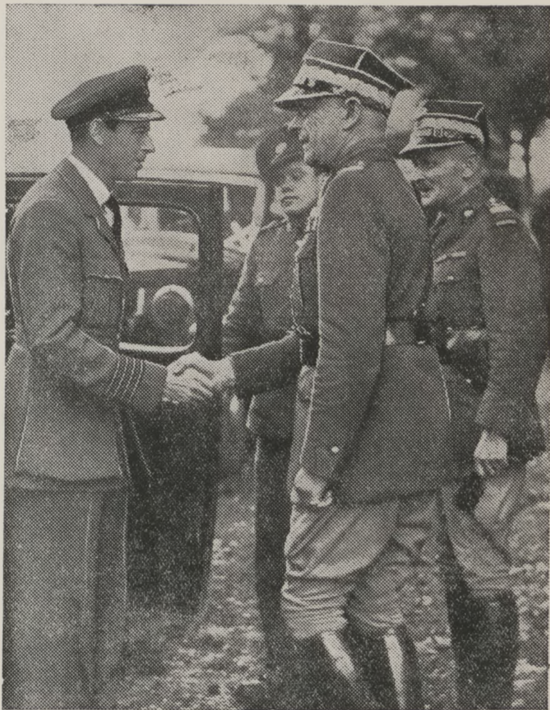
Książę KENT'u odwiedza oddziały polskie w obozie „gdzieś w Anglii“.