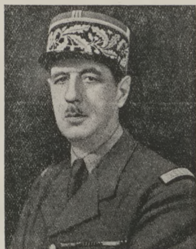
Gen. Charles de Gaulle.

London, 3.3.(AFI). Przywódca ruchu Niezależnych Francuzów gen. de Gaulle wygłosił ostatnio, na zebraniu kolonii francuskiej w Anglii, przemówienie w którym wskazał m.in. na czynniki decydujące w nowoczesnej wojnie.