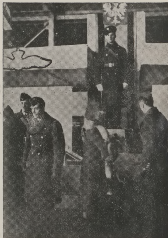
Brytyjska para królewska wśród lotników polskich.

Gdy Kanadyjczycy dotarli do wybrzeża, gdzie miał wylądować nieprzyjaciel, przystąpili w nocy do ataku. Wysunięte oddziały trzymały nieprzyjaciela w szachu i ułatwiły upozorowany atak za dnia pozostałym siłom głównym.