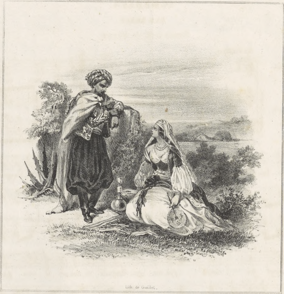
Lib. de Guillet.