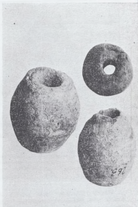
Ciężarki gliniane (Plesewo, pow. Grudziądz)