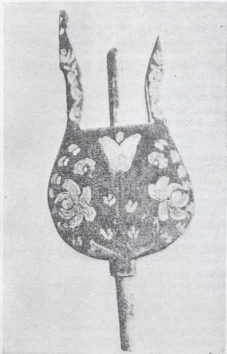
Deseczka rzeźbiona, malowana, tzw. kracek do nawijania kądzieli (Wdzydze, pow. Tuchola)

skiego 80 lat temu. Nieco później pozyskano dalsze przedmioty z tej samej dziedziny. Jednak z braku większego zainteresowania tymi zbiorami ze strony ówczesnego aktywnego miłośników zabytków — nie odegrały one poważniejszej roli w ekspozycji Muzeum.