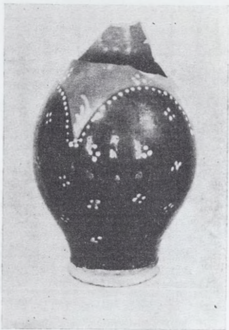
Dzban gliniany, malowany i glazurowany (W. Welcz, pow. Grudziądz)

W Polsce Ludowej, do roku 1955, zabytki etnograficzne zostały potraktowane na równi z innymi muzealiami, co stanowiło przełomowy moment w dotychczasowej ekspozycji zbiorów etnograficznych w Muzeum. Pierwsza opracowana tematycznie wystawa zbiorów dawała skromny wprawdzie ale interesujący materiał, ilustrujący ważniejsze dziedziny kultury ludowej podgrudziądzkich wsi.