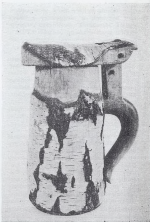
Kufel drążony w pniu brzozy (Świecie n. Osą, pow. Grudziądz)

SZTUKA LUDOWA: ozdobne wyroby z drewna, przęślica bogato rzeźbiona, śparogi i pazdury, ozdobna ceramika kaszubska i huculska, skrzynie wianowe oraz hafty.