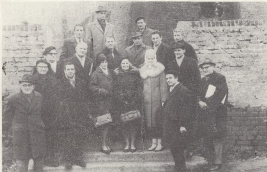
Imprezą zamykającą VIII Zjazd Społecznych Opiekunów Zabytków było zwiedzanie Grudziądza i jego zabytków. Na zdjęciu grupa uczestników Zjazdu na tle zabytkowych murów obronnych.