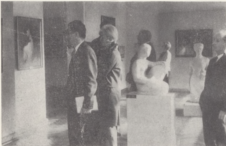
W przerwach między obradami przedmiotem zainteresowania uczestników VIII Zjazdu były także zbiory grudziądzkiego Muzeum.

ośrodków w kraju. Wykładowcami „Uniwersytetu” będą muzeolodzy oraz pracownicy naukowcy UMK w Toruniu. Zajęcia dla słuchaczy będą się odbywały we wtorki, w godzinach wieczornych.