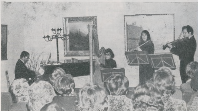
Kwartet „Eolina” z Sofii podczas koncertu w naszym Muzeum w dniu 23.XI.1976