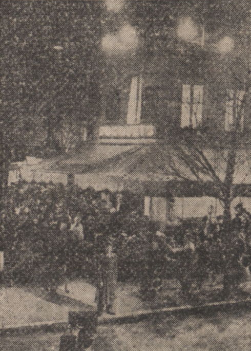
Scena ze zdjęcia do filmu „Luk Tryumfalny” wykonywanego obecnie w Hollywood z Charles Boyerem...