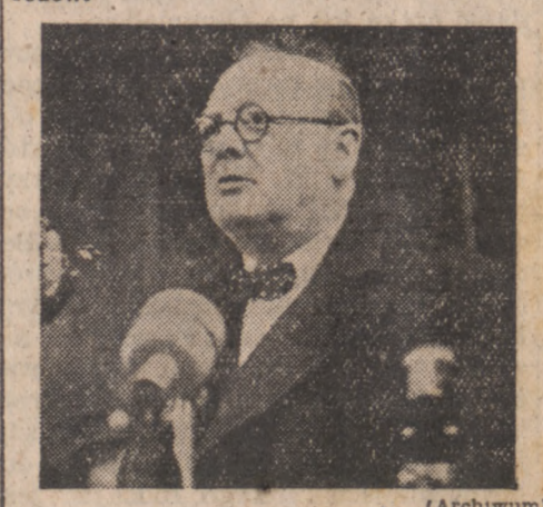
Churchill w trakcie wygłoszenia przemówienia