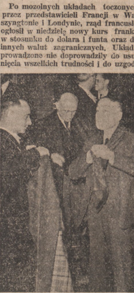
Robert Schuman i René Mayer po rozmowach z rzeczoznawcami angielskimi wychodzą z gmachu przy Quai d'Orsay.

podległości”. „Wiadomości” i t. p. będą musieli wkrótce pogodzić się z myślą, że nie oni, lecz im się będzie stawiali warunki, jeśli nie zechcą pozostać poza powstającym zwartym frontem wszystkich Polaków na obczyźnie.