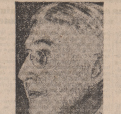
B. Baruch, delegat Stanów Zjednoczonych do O. N. Z.