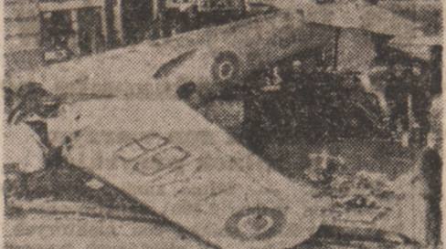
Dwie osoby, ktore znajdowaly sie w zamo- kcie „Anson” w chwili gdy wpadl na auto- bus w Londynie, poniosly smierc.

LONDYN. — Zastepcy Wielkiej Czworki zebraли sie we wtorek, by naradzic sie nad sprawa dawnych kolonii wloskich.