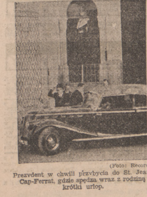
Prezydent w chwili przybycia do St. Jean Cap-Ferrat, gdzie spędza wraz z rodziną krótki urlop.