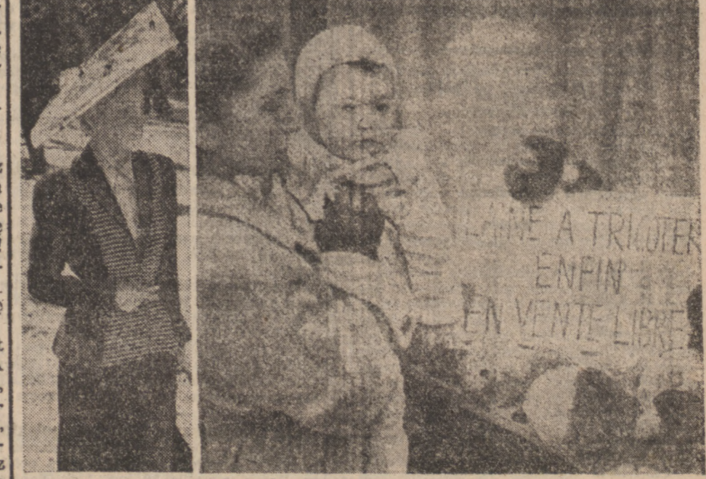
Complek włosenny. Młoda mamusia z pociechą na ręku, ogląda wełnę, którą obec- nie będzie mogła nabywać bez ograniczeń.