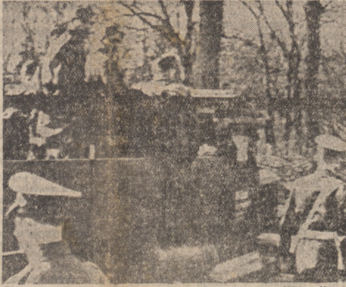
Postępunek angielski zatrzymał samochód ciężarowy z towarami kontrolnymi na stacji, prowadzącej do lotniska angielskiego w Gatow.

BERLIN. — W poniedziałek o godz. 3.25 opuścił strefę zachodnią brytyjski wojskowy pociąg osobowy, udając się do Berlina. W dwie minuty po przybyciu do strefy rosyjskiej, wyruszył dalej bez żadnej kontroli ze strony rosyjskich władz wojskowych. W pociągu tym jechał do Berlina brytyjski gubernator wojskowy general Robertson oraz brytyjski minister Lotnictwa Henderson.