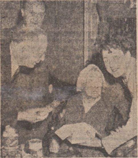
Pani Rachilde jest najstarszą literatką francuską. W dniu urodzin przeżyła 90 lat...