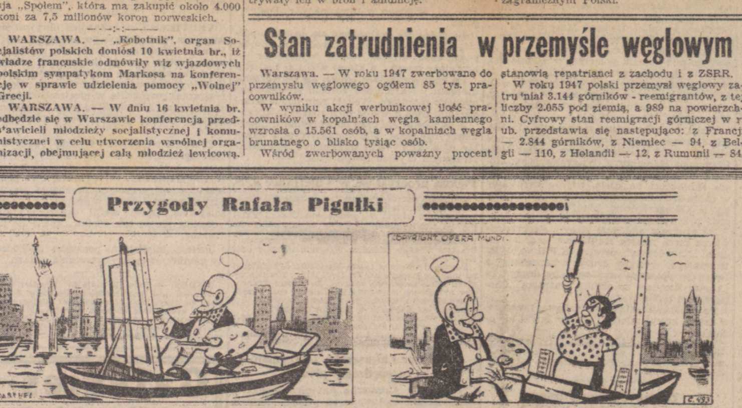
W Nowym Yorku pomnik wolności. Wybrał dla swej miłości. Tem to model nad modelem. Naśladowajcie bardzo śmiecie.