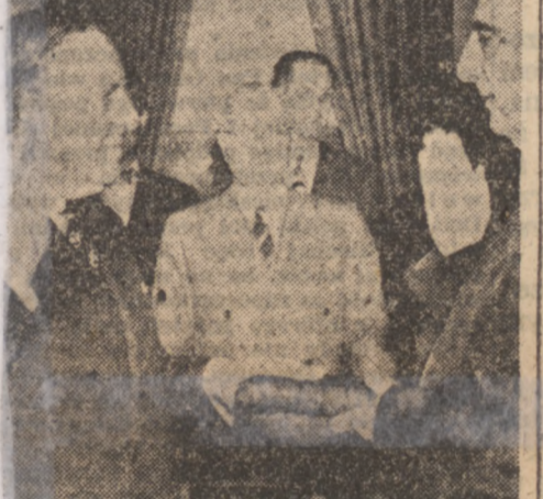
Paul Hoffman, mianowany administratorem planu Marshalla, złożył uroczyste przysięgę w obecności p.p. Vinsona, ministra...