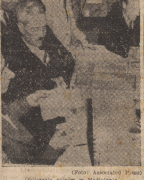
Obliczanie głosów w Mediolanie.

RZYM. — W wyborach do Senatu w 40.407 okręgach wyborczych na 41.647 otrzymała: Chrz. Demokracja 9.246.443 47,9% Front Ludowy 5.882.253 39,9% Socjaliści Saragata 1.348.511 7% Blok Narodowy 1.295.490 6,6% Republikanie 516.132 2,6% Ruch Społeczny włoski 243.353 1,3% Niezależni 190.030 1% Monarchiści 415.463 2,2% Federaliści 50.618 0,3% Ruch Nacionalistyczny 4.898 -