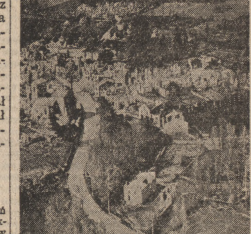
Widok Oradour-sur-Glane. Uroczystości w Oradour-sur-Glane...

Limoges. — W zastępstwie premiera Roberta Schumana przewodniczył uroczystości upamiętniającej meczeskie przeżycia Oradour-sur-Glane p. Max Lejeune, sekretarz Stanu dla Sił Zbrojnych. Miasteczko, które 10 czerwca 1944 r. przez Niemców spalono i większość ludności rozstrzelano, Rząd przyznał miastu Krzyż Wojskowy z palmą.