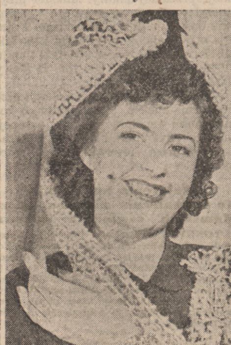
Miss Avelyn Macaskill, królowa piękności Afryki Południowej...