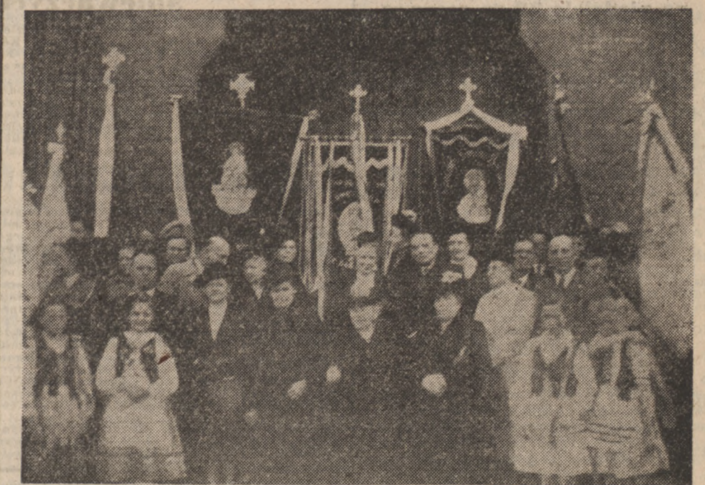
Kolonja polska w Waziers wzbogaciła się o dwa nowe sztandary. Organizacjami, które je uzyskały są Kolo Polek i Bractwo Różańca Matek.