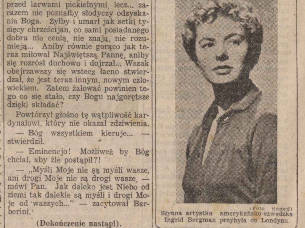
Słynna artystka amerykańsko-szwedzka Ingrid Bergman przybyła do Londynu. (Dokończenie nastąpi.)