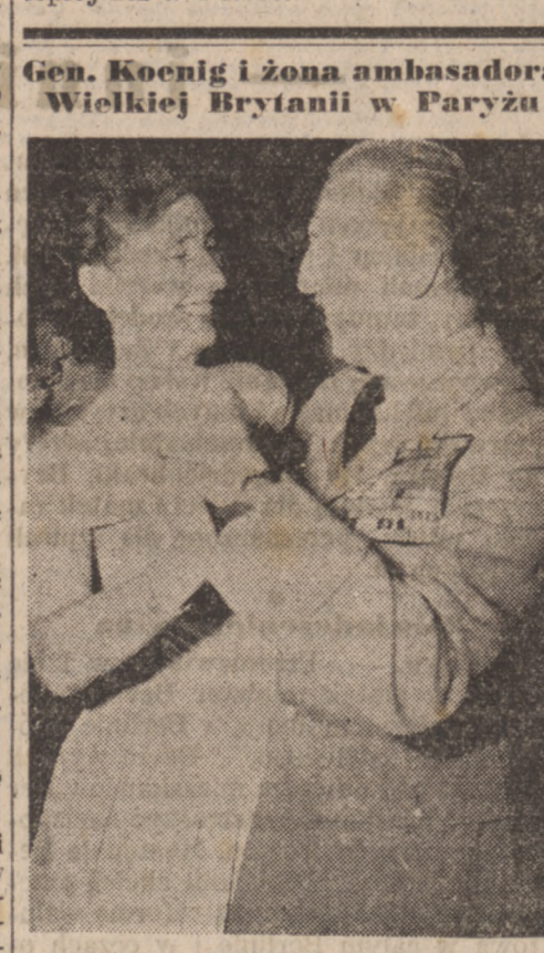
Liczne osobistości ze świata artystycznego i politycznego wzięły udział w „noej Luwru” zorganizowanej w salonach Ministerstwa Skarbu...

Gen. Koenig i żona ambasadora Wielkiej Brytanii w Paryżu