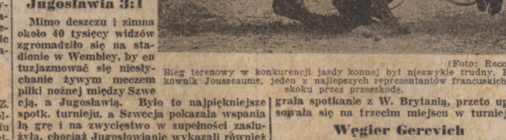
Bieg terenowy w konkurencji lady konnej był niesłychanie trudny. Niesłuchanie zwyciężyła Francuzka, która była jedną z najlepszych reprezentantek francuskich po skoku przez przeszkodę.

Mimo deszczu i zimna około 40 tysięcy widzów zgromadziło się na stadionie w Wembley, by zobaczyć mecz między Szwecją a Jugosławią. Był to najpiękniejszy mecz w historii futbolu. Szwecja pokazała wspaniałą grę i na zwycięstwo w zupełności zasłużyła, chociaż Jugosławianie wykazywali również niezwykłą zaciętość i bardzo dobrą technikę. Pierwsza połowa meczu toczyła się pod zdecydowaną przewagą Szwedów, chociaż wyniki był wtedy tylko 1-1. Po przerwie Jugosławianie mieli lekko przewagę ale doskonały atak szwedzki strzelił jeszcze dwie bramki (ostatnią z karnego). Pod koniec gry była nieco brutalna i ostateczny wynik był 3-1 dla Szwecji. Ponieważ Dania wy-