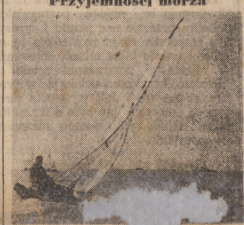
Slicznie wygląda lód, wala kołysząca się na falach morskich, niezwykle życzliwa, aby kierować nią na wzburzonym morzu.