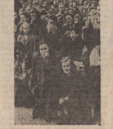
Niezłoczona rzecz Czechów są bratni w omach tętniący zwłoki swego prezidenta Edwarta Beneša.