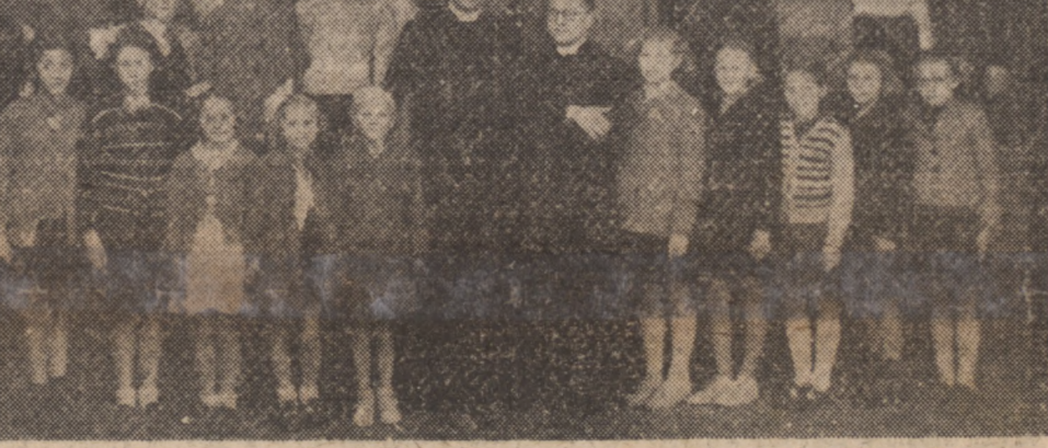
Grupa polskich dzieci z Berlin, które brały udział w Koloniami Letnich dla polsko-katolickich dzieci.

Byłoby to niezgodne z naturą i postawą człowieka, który w przyszłym roku wróci do niego i to na dłuższy okres czasu.