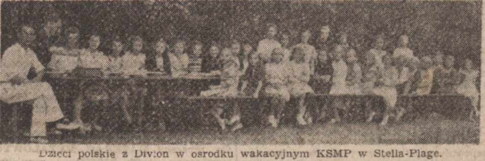
Dzietci polskie z Divion w ośrodku wakacyjnym KSMP w Stella-Plage.

W ośrodku panowała atmosfera szczerzej przyjaźni i prawdziwej radości. Jedzenie wprawdzie nie wyszukane, ale bardzo treści-