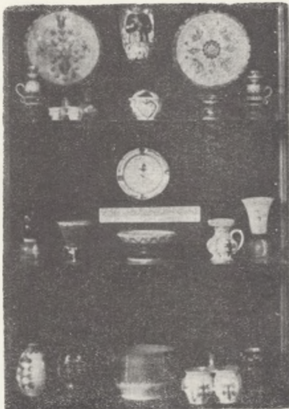
Fragment wystawy ludowej ceramiki kaszubskiej — w grudziądzkim Technikum Ekonomicznym

BRONŃ SIECZNA XIX I XX WIEKU. Pokaz broni siecznej ze zbiorów Muzeum (m. in. bagnety różnego rodzaju, pałasze, szable) zorganizowany w Technikum Chemicznym i Elektrycznym w Grudziądzu w okresie od 6 do 20 czerwca 1968 r.