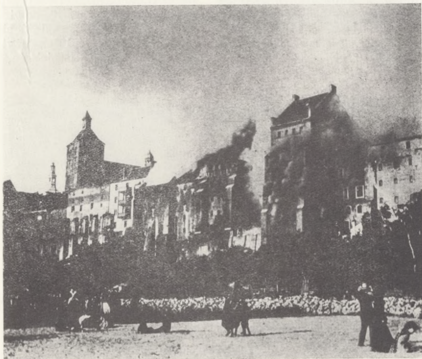
Pożar spichrzy w 1903 r.

lem adaptacji na cele muzealne, pracownie i magazyny. Wniosek Muzeum został załatwiony pozytywnie. Dokumentację techniczną spichrza wykonały Pracownicy Konserwacji Zabytków Oddział w Toruniu, a robót remontowo-budowlanych podjęła się Spółdzielnia Remontowo-Budowlana w Grudziądzu. Prace finansowane były przez Wojewódzkiego Konserwatora Zabytków w Bydgoszczy oraz Prezydium MRN w Grudziądzu. Tak więc podjęta przed kilkoma laty akcja ratowania zagrożonego obiektu została już niemal