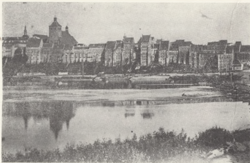
Panorama Grudziądza od strony Wisły z II poł. XIX w.

Wprowadzono w ten sposób dalsze szpecące elementy, naruszając właściwą harmonię kompozycyjną tego rodzaju obiektów.