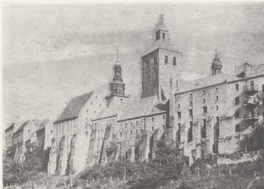
Widok ogólny grudziądzkich spichrzy nad Wisłą (patrz artykuł J. Błachnio: „Zabytki grudziądzkiej architektury — Spichrze”, str. 20)

Muzeum w Grudziądzu jest otwarte we wtorki w godz. 10.00—18.00, w środy, czwartki, piątki i soboty w godz. 10.00—15.00, w niedziele i święta w godz. 10.00—14.00. W poniedziałki i dni poświęczone Muzeum jest zamknięte. We wtorki wstęp bezpłatny. W pozostałe dni opłata wynosi: normalna — 1 zł, ulgowa — 0,50 zł, a dla grup powyżej 10 osób — 0,25 zł od osoby.