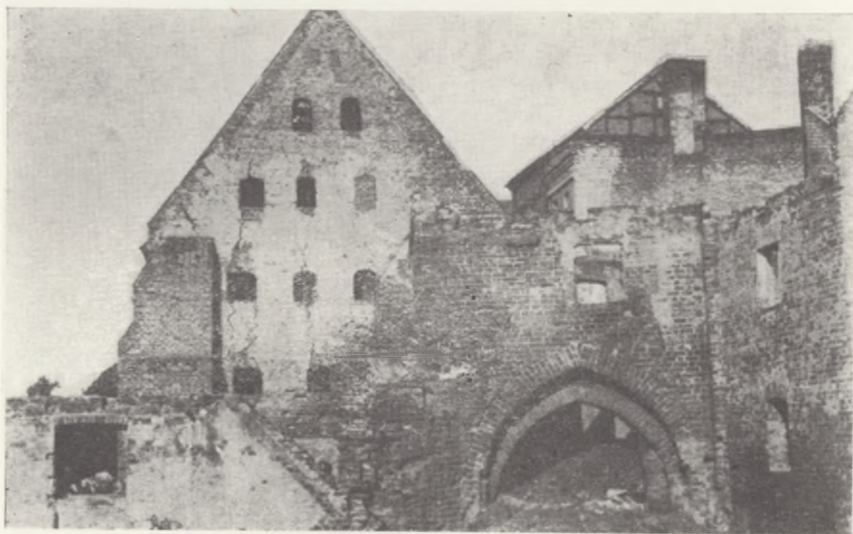
Widok na Bramę Wodną i spichrz nr 9 w 1954 r.

Nie wszystkie jednak spichrze mają odpowiedniego użytkownika, który nie tylko je eksploatuje lecz zabiega również o właściwą konserwację. Doprowadziło to w kilku wypadkach do szybkiego zmurszenia więźby i drewnianych stropów (np. w spichrzach nr nr 15 i 17). Obecnie oba te obiekty wymagają już remontu kapitalnego. Jeden z nich (nr 17) zostanie zaadaptowany na schronisko turystyczne; projekt wstępny jest już w opracowaniu. Drugi jednak, jak i spichrz nr 13, powinny jak najszybciej znaleźć się w rękach odpowiednich użytkowników. Pozostałe spichrze są