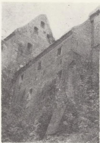
Spichrz nr 51 — najbardziej zagrożony

Grudziądzkie spichrze nad Wisłą należą — jako zespół — do grupy I zabytków, mimo że spichrze: 9, 11, 13, 15, 17, 47 zostały zaliczone do grupy II, a pozostałe do grupy III. Nakłada to na gospodarzy naszego miasta odpowiedzialność za stan tych zabytków, a użytkowników zobowiązuje do ich właściwego konserwowania i ochrony. Poczynione już kroki w zakresie przekazywania spichrzy właściwym użytkownikom oraz podjęte konserwacje i adaptacje niektórych obiektów pozwalają przypuszczać, że ten cenny zespół zabytkowej architektury naszego miasta zostanie zachowany. Tym samym zapewni się temu zespołowi zabytków warunki do dalszego istnienia oraz pełnienia historycznej, atrakcyjnej, a także użytkowej roli i to nie tylko w najbliższych latach ale i w wiekach następnych.