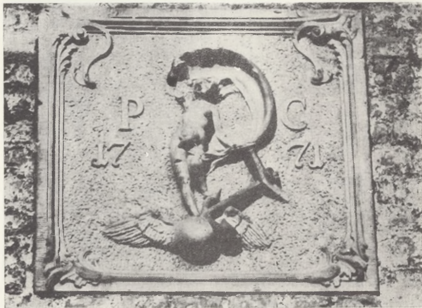
Tablica pamiątkowa umurowana w roku 1771 na spichrzu nr 45

pożarze Grudziądza w 1341 r. spichrz „za opłatą wieczystego czynszu i za zgodą komtura miejscowego zamku Henryka z Bowentin”. Od tej pory przybywało ich coraz więcej. Stanowiły one główne punkty skupu i sprzedaży zboża dostarczanego tu z okolic Grudziądza, a nawet z terenów sąsiedniej Ziemi Lubawskiej. W roku 1400 w samym tylko spichrzu zamkowym znajdowało się ponad 10 tysięcy mierzyc żyta.