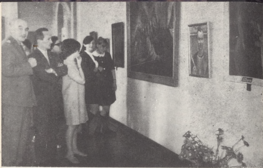
Podczas zwiedzania wystawy prac Jacka Malczewskiego

wydrukowana przez Grudziądzkie Zakłady Graficzne. Cena 1 egzemplarza wynosi 10 zł.