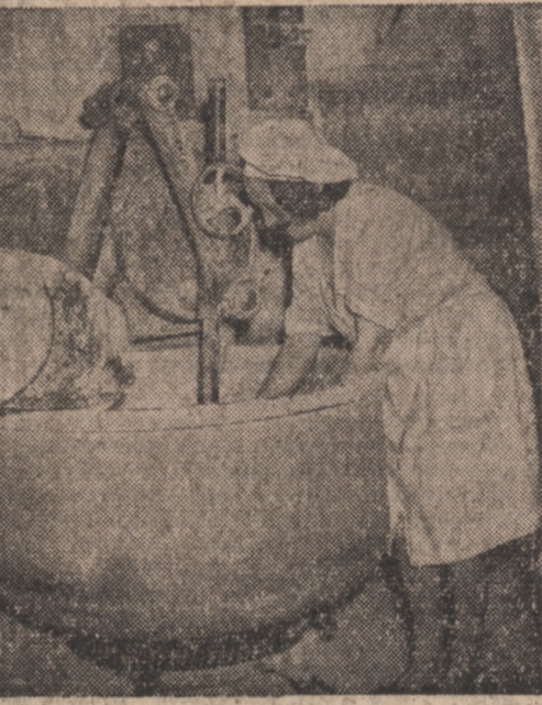
Wobec strajku robotników piekarskich w Paryżu piekarze nie mogą przy pomocy żon starszy się dokonać wypieku kłopotliwej chleba.

Przytoczył dyskusję stała się interpelacja posła Fajon w sprawie zarządzeń rekwizycyjnych, jakie powziął rząd w odniesieniu do robotników elektryczni i gazowicy. Premier Ramadier, poparty przez MRP, zażądał odroczenia dyskusji nad interpelacją.