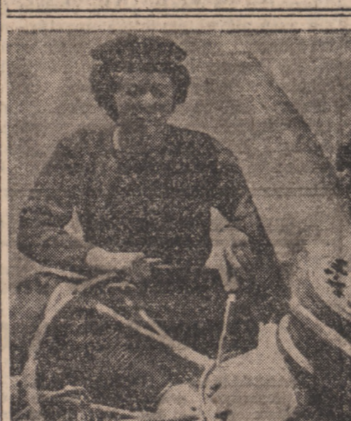
Zawód dla kobiet dwudziestego wieku. Marynarka brytyjska utworzyła ośrodek nauki dla młodych Angielek...