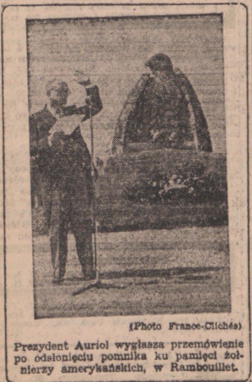
Prezydent Auril wygłasza przemówienie po odwołaniu pomnika ku pamięci żołnierzy amerykańskich, w Rambouillet.

PARYZ. — W ramach procesów przeciwko byłym członkom rządu Włochy wyznaczony został na 22 czerwca proces przeciwko Piotrowi Cathali, ministrowi poczty rządu Lavallo. Po Cathali zaginal jednak wszelki ślad od sierpnia 1944 roku i nie sądzono, aby zjawił się na rozprawę. Tymczasem do sądu nadszedł list, w którym Cathala donosi, że przebywa w Paryżu u brata swego i że gołow jest stanął przed sądem. Lekarz egdwoy stwierdził jednak, że Cathala jest ciężko chory i niezdolny do przetransportowania go do więzienia. Cathalę pozostawiono na wolności tymczasowej.