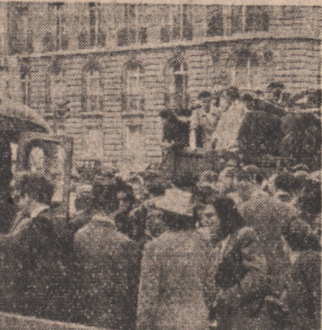
Podróżni na Placu Inwalidów czekają na kolebkę przed samochodami ciężarowymi i autobusami.

Wśród przed południem premier Ramadier przyjął ponownie zarząd główny C.G.T. Rozmowy prawdopodobnie dotyczyły listu, wystosowanego przez Premiera do sekretarza gen. C.G.T.