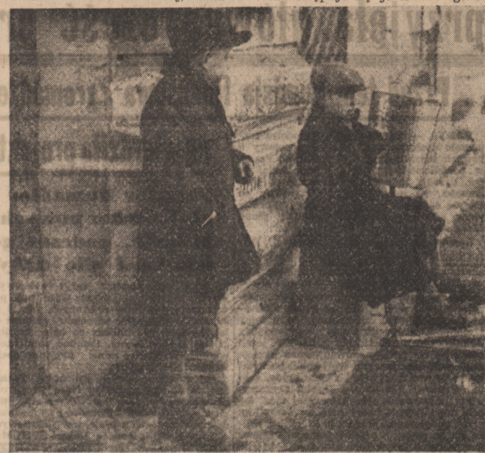
Chłopczyk przysłuchujący się akordeonieście grającemu popularną piosenkę „Zaszumiły wierzby”

Mimo ruin i zniszczeń, do których oko po pewnym czasie przyzwyczaja się, mimo oczywistej nędzy i biedy, stonkownie mało widocznej, mimo że