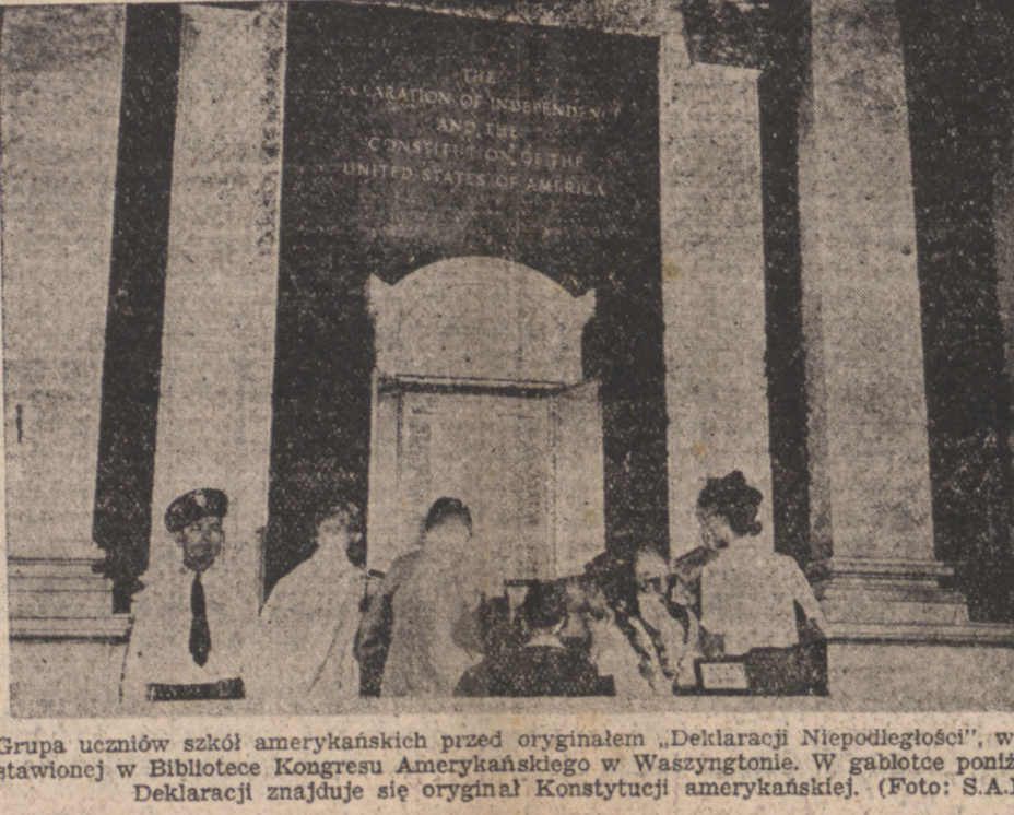
Grupa uczniów szkół amerykańskich przed oryginałem „Deklaracji Niepodległości”, wystawionej w Bibliotece Kongresu Amerykańskiego w Waszyngtonie.

WASZYNGTON. — Amerykański Departament Rolnictwa oświadczył, iż Belgia otrzymała dodatkowo 200 tysięcy funtów snu i fasoli oraz 30 tysięcy funtów oliwy do końca bieżącego miesiąca.