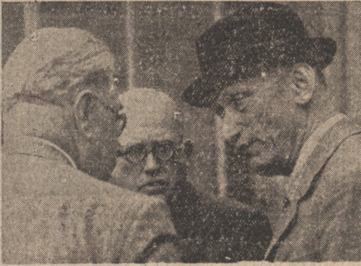
Premier Ramadier, prezydent V. Auriol i minister Finansów Schuman w rozmowie po zakończeniu posiedzenia gabinetu.