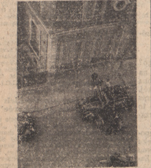
Komisja śledcza przed domem, w którym wykryto tajną składnicę broni.