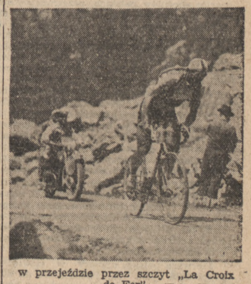
w przejeździe przez szczyt „La Croix de Fer”.