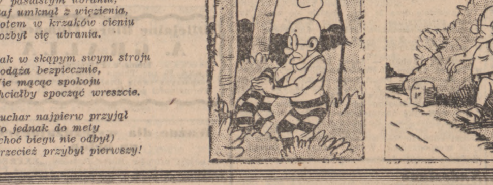
W pasiastym ubranku, Raf unknął z wściekłości, potem w krzakach cieniu poszyb się ubrania.