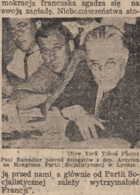
Paul Ramadier...

Paryż. — Miarodajne dzienniki francuskie omawiają obszernie wyniki kongresu francuskiej partii socjalistycznej w Lyonie.