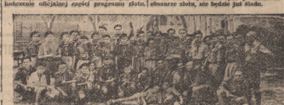
Grupa harcerzy polskich z Francji, która zwiędzia Jamboree.