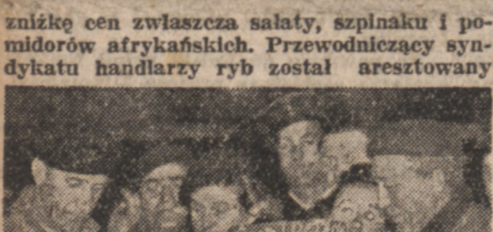
Na straganach paryskich, zgodnie z rozporządzeniem rządu, obok cen sprzedaży widnieją ceny zakupna.