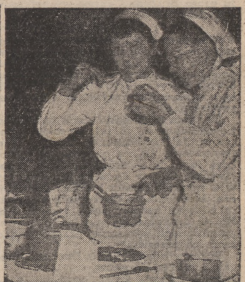
Dwie kandydatki do tytułu „Czarodziejki domowej”, kosztują przyrządzonej potrawy.

Z 115 kandydatek, 16 zostanie nazwanych „czarodziejkami”. Będą to kandydatki, które wywiązały się najlepiej z zadań z zakresu gotowania, zycia, cerowania, prasowania i odpowiedzą na pytania, dotyczące opieki nad dzieckiem, higieny, wychowania i organizacji domowej. Dla „czarodziejek” są przewidziane nagrody pieniężne i różne sprzęty, jak piecze kuchenne lub gazowe, maszyny do prania, nakrycia stołowe i t. d.