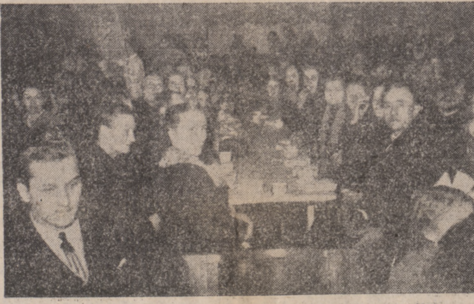
Dwa fragmenty z gwiadzki, która urządziła kolonia polska w Sallamumines. U góry grupa działaczy przy podwieczorku, u dołu grupa starszych przy śniadaniu zastawionym placikiem polskim i kawą.