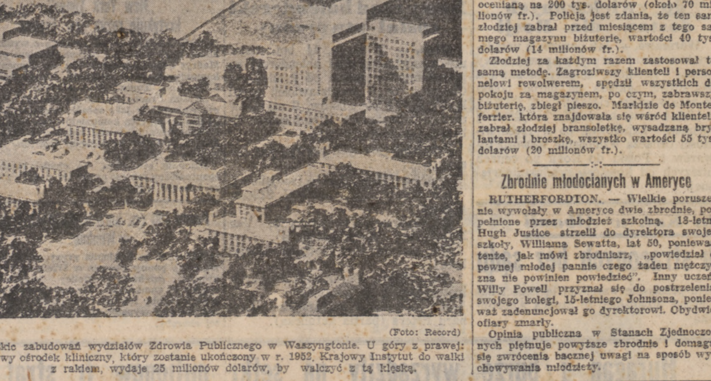
Szkół zabudował wydział Zdrowia Publicznego w Waszyngtonie. U góry z prawej: nowy ośrodek kliniczny, który zostanie ukończony w r. 1952. Krajowy Instytut do walki z rakim, wydatki 25 milionów dolarów, by walczyc z tą chorobą.