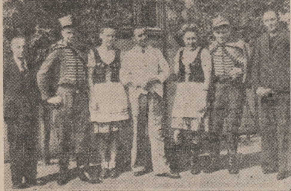
Grupa zespołu „Gwiazda Jedność” z Houdain, konkurująca o pierwsze miejsce w Związku ze sztuką „Huzar i Woltyżer”.

Większe jeszcze jest zainteresowanie między samymi zespołami, a w szczególności amatorami czy amatorami, występującymi w tym dniu, gdyż w