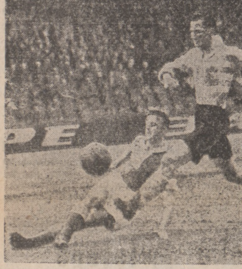
Reims i R.C. Paryż podzielili się punktami...