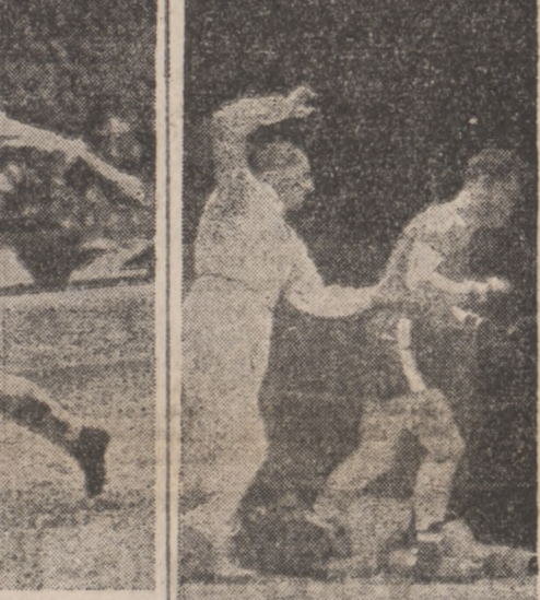
Zwyciężyli w różny sposób...