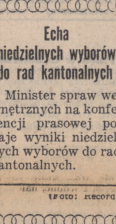
Echa niedzielnych wyborów do rad kantonalnych. Minister spraw wewnętrznych na konferencji prasowej podaje wyniki niedzielnych wyborów do rad kantonalnych.

PARYŻ. — Kursy papierów wartościowych na giełdzie paryskiej zwykowały w czasie od grudnia do ubiegłego tygodnia o 54 proc. Doszły mianowicie do wskaźnika 1.452, w porównaniu do 1.476 w 1948 r. 1.404 w 1949 r. i 1.162 w 1950 roku. 29 grudnia ub. r. wskaźnik sigał tylko 944 punktów.