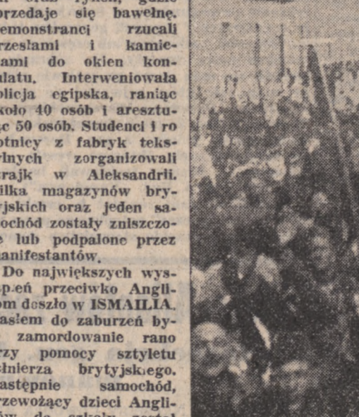
Scena z manifestacji w Aleksandrii.

jest 3 zabitych i kilkudziesięciu rannych. Bank Barkley'a oraz wiele magazynów brytyjskich zostały złupione.