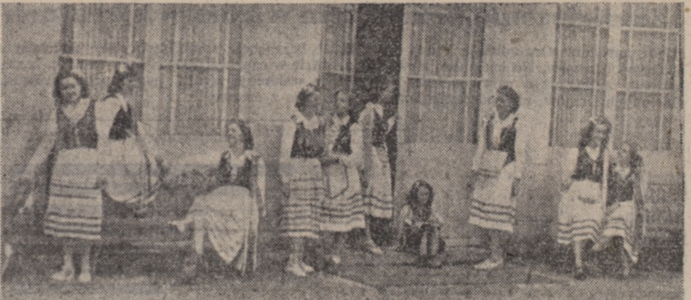
Życie polskiej młodzieży katolickiej w Troyes zostało zorganizowane w KSMP. Jakkolwiek oddział należy do najmłodszych przy Związku młodzieżowym, który istnieje już 25 lat, niemniej może się wykazać poważnymi osiągnięciami na polu teatralnym i pracy społecznej. Praca nad zorganizowaniem jak najwięcej młodzieży, utrzymanie skarbu kultury polskiej, przez występy, odczyty, referaty, itd., stanowi główną troskę organizacji. KSMP w Troyes nie ogranicza swej pracy wyłącznie do swej miejscowości. Sieć gałęzią poza jego obręb a nie tak dawno wzięło udział w święcie zorganizowanym w Sainte Maure. Poza Polakami uczestniczyli w nim również Francuzi, tak że światło to stało się obchodem przyjaźni polsko-francuskiej. Na zdjęciu grójka, druhen z K.S.M.P. przygotowują się do występów na święcie w Sainte Maure. Na pierwszym planie drużna Maria-Luiza Mamzak, prezeska KSMP w Troyes.