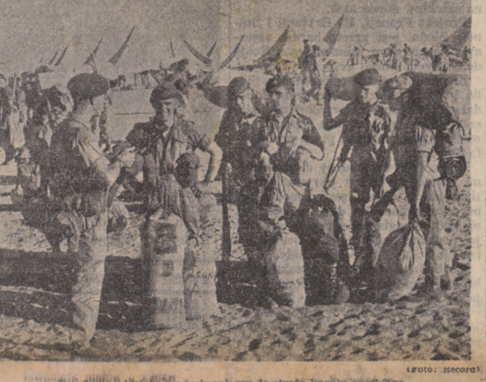
Przybyłe oddziały spadochroniarzy do strefy kanału sueskiego.

Ataki prasy egipskiej na oddziały brytyjskie. Prasa egipska atakuje nieustannie oddziały brytyjskie w strefie kanału sueskiego. Dzienniki egipskie podają opisy z akcji działalności członków oświatowych „batalionów wyzwolenia”, które zdobyły jakoby czołg brytyjski oraz dokonały licznych wypadów przeciwko brytyjskim żołnierzom.