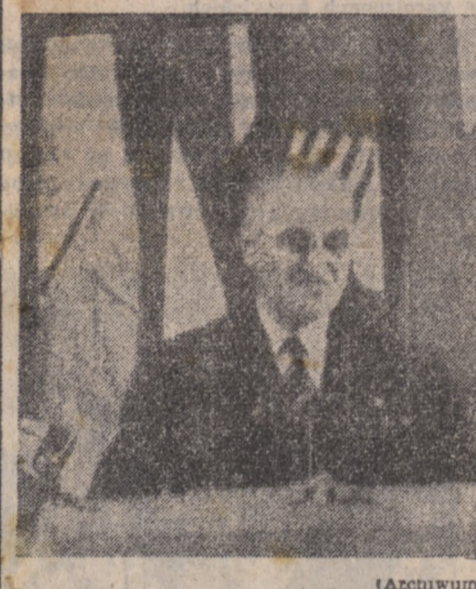
Prezydent Truman przemawia.

nia swoich sił obronnych, które okazały się potrzebne, i aby ewentualny napastnik nie mógł się spodziewać łatwej i szybkiej zdobyczy. Jeśli Kreml dojdzie do stwierdzenia, że jego polityka agresywna nie opłaca się, to może