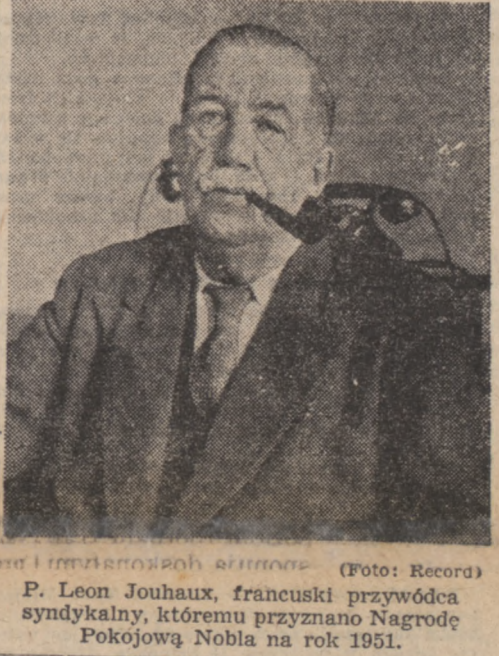
P. Leon Jouhaux, francuski przywódca syndykalny, któremu przyznano Nagrodę Pokojową Nobla na rok 1951.