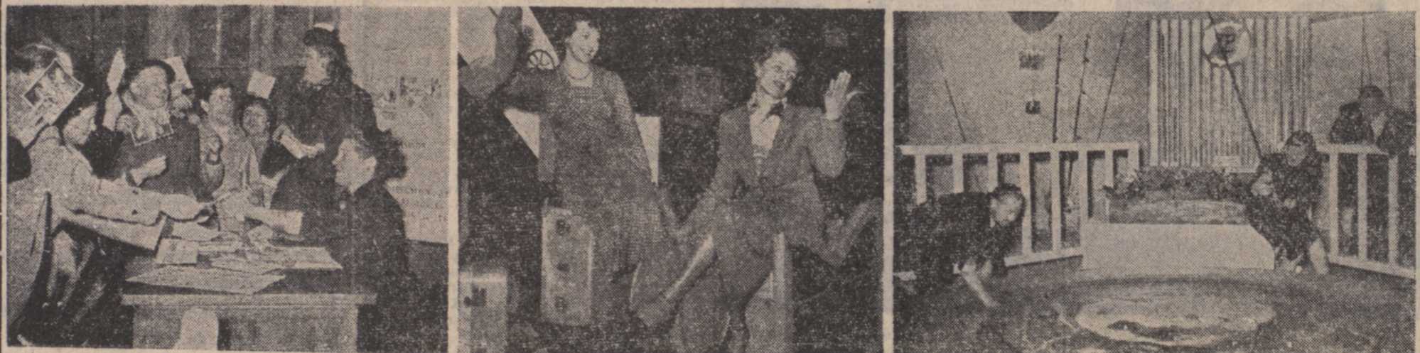
Artystka radiowa, Germaine Sablon, rozdaje swoje fotografie „Zaproszenie do podróży”, na paryskiej wystawie-Amatorzy rybołówstwa łowią lososie w sadzawce, zainstalowanej na wystawie.