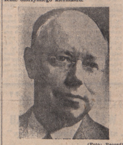
Senator Taft.