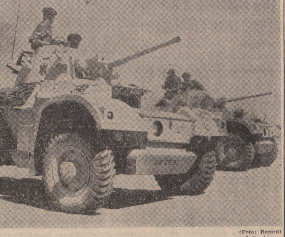
Brytyjskie jednostki pancernie uzbrojone są w nowoczesne czołgi, typu „Centurion”. Zarówno jednostki brytyjskie na terenie Anglii, jak i dywizje pancerne w Niemczech zachodnich, posiadają ten nowoczesny sprzęt.