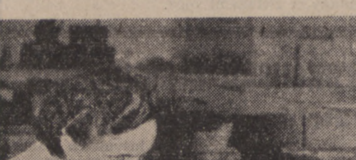
Biblioteka Narodowa w Paryżu posiada obecnie własną introligatornię, aby nie wyjadać poza obręb Biblioteki cennych dzieł, jakie posiada...