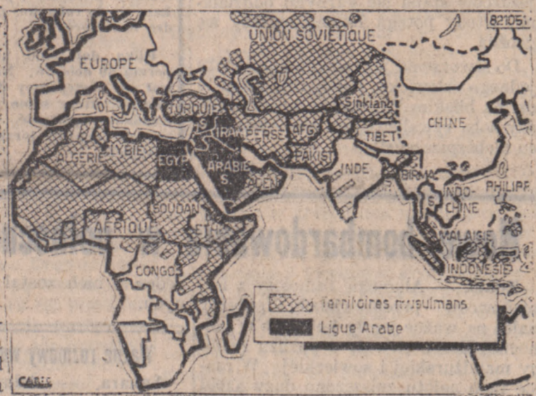
Pola zakreślane przedstawiają obszary zamieszkałe przez ludność muzułmańską. Pola czarne oznaczają kraje wchodzące w skład Ligi Arabskiej.

ku, jakkolwiek sultan rozumie, że współpraca tego kraju z Francją daje wyniki korzystne dla kraju, bo sprzyja podniesieniu ekonomicznemu, zajmującemu się z tym krajem, nie jest szczere. Zainteresowanie tym zagadnieniem wzrosło znacznie, w związku z decyzją sobotnią Wspólnoty Węglowo-Stalowej, w sprawie propozycji przyjęcia konstytucji dla projektowanej federacji europejskiej.