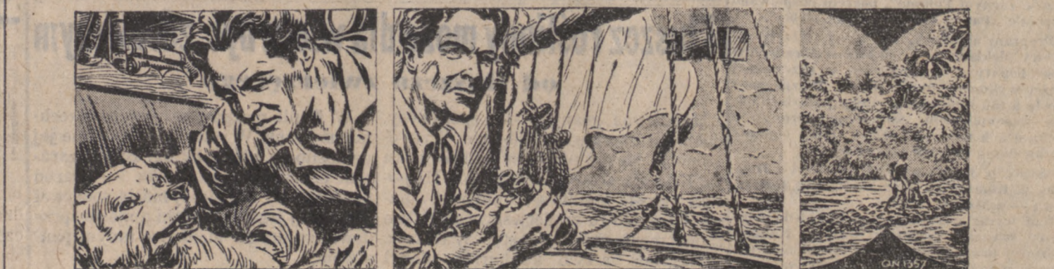
(Ciąg dalszy — Odcinek nr. 76)