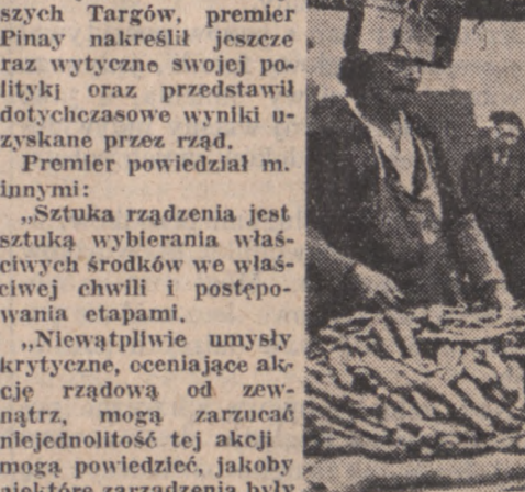
Rząd premiera Pinay przywrócił system wywiasek z dwójkami i cenami, zastopowany w listopadzie 1947 r. przez p. Julesa Moch.

„Skutki akcji rządowej jednak dadzą odczuć się dopiero stopniowo”