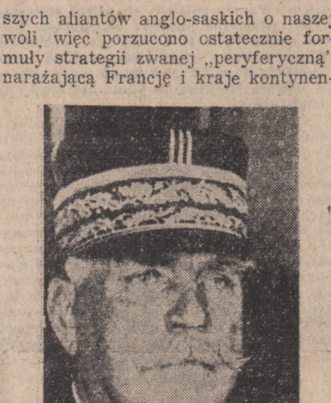
Marszałek Joffre, zwycięski dowódca w bitwie nad Marną.