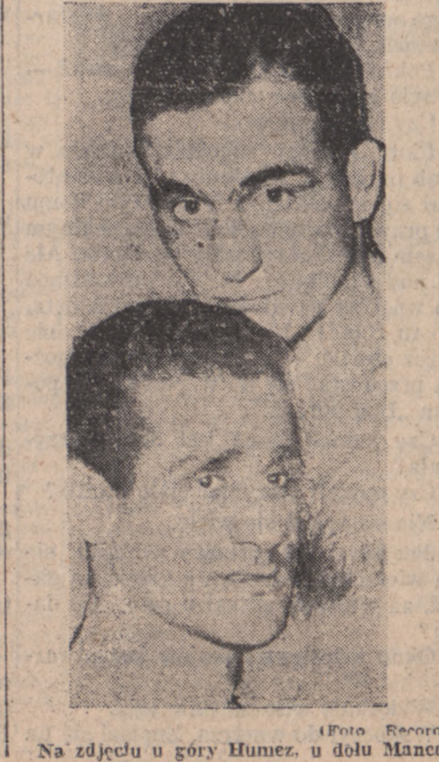
Na zdjęciu u góry Humez, u dołu Monaco.