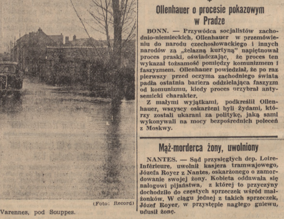
Rzeka Loing (dopływ Sekwany) wylata w Varennes, pod Souppes.