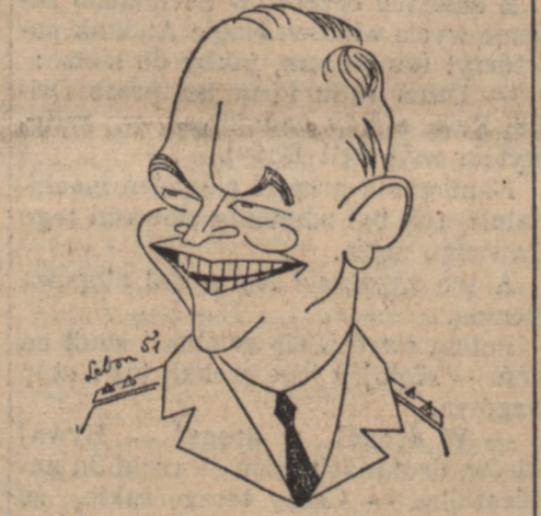
Gen. Eisenhower w karykaturze

NOWY JORK. — Według „New York Post”, amerykańska artyleria będzie mogła wystrelić pierwszy pocisk atomowy w ciągu najbliższych 20 dni.