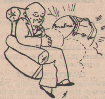
Marzenie paskarza: — To byłoby interes!