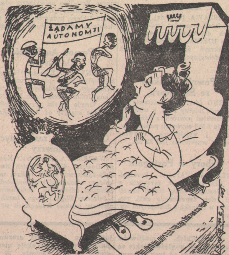
Królowa Wilhelmina: — Czy to sen, czy Jawa?

(—) KAROL POPIEL (—) ZYGMUNT FELCZAK Toruń, 14 listopada 1945 r.