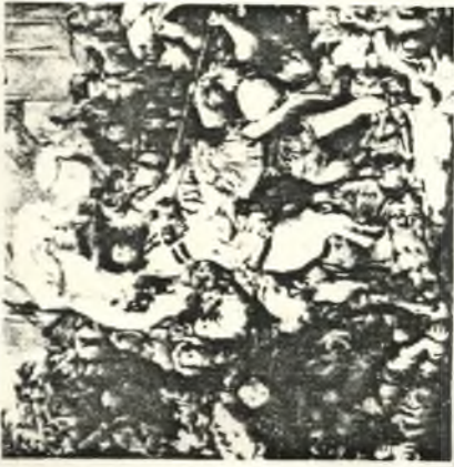
FRAGMENT Z OBRAZU „GRUNWALD” JANA MATEJKI

W ROKU 1410 dnia 15 lipca, połączone wojska polskie, litewskie, smoleńskie, kijowskie, czeskie i morawskie, silnie swoją jednością stoczyła na polach Grunwaldu zwycięską bitwę ze śmiertelnym urogiem Słowiańszczyzny - krzyżakami.