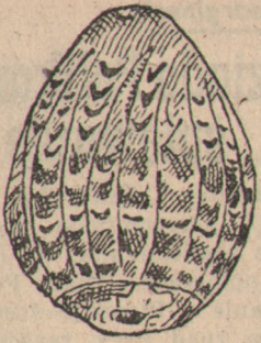
Znaleziona w Poznaniu pisanka gliniana z XI w.