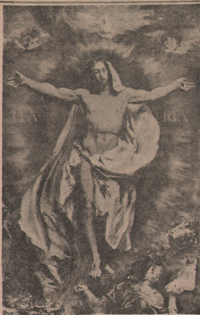
JAN MATEJKO: „ZMARTWYCHWSTANIE” (ol.)

Zwycięstwo nasze nad złymi mocami musi być ugruntowane. Żyjemy dalej w czasach niespokojnych, kiedy zasady, którym Polska chce służyć, jeszcze nie zdołały przeniknąć ludzkość. W dalszym ciągu nad światem zbierają się groźne chmury, które nie wróżą nic dobrego. Ludzkość, jakkolwiek może owiana chęcią wzajemnej współpracy i służenia pokojowi, szamoce się nadal konwulsyjnie i nie może wyzbyć się wzajemnej nieufności. Żądza panowania nad światem przysłańia niektórym oczy i przekreśla podstawową prawdę, że w miłości i zgodzie oraz poszanowaniu praw i wolności innych tkwi źródło szczęścia narodów, w ich braterskim współzyciu wyrażającym się w międzynarodowej wymianie narodowych wartości. Musimy pracować nad tym dalej, aby zasady te i niewzruszone prawdy ostatecznie zwyciężyły. Zanim się to stanie, winniśmy, czujni na niebezpieczeństwa, jakie zagrażają ludzkości, pracować nad scementowaniem Narodu i wykrzesaniem z Niego wszystkich sił potrzebnych Polsce, aby się mogła ostać na zawsze, aby się już nie powtórzyły Golgoty naszej historii, aby nasze zmartwychwstanie, jak zmartwychwstanie Chrystusa, było ostateczne — było triumfem chwały Narodu Polskiego.