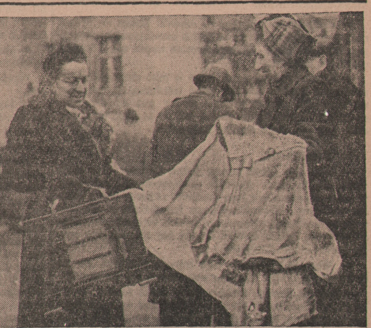
Handel powojenny w Berlinie w wielkiej części opiera się na wymianie. Na ulicach i placach do tego przeznaczonych spotkać można tysiące mieszkańców zniszczonej stolicy Niemiec, oferujących do wymiany najróżniejsze przedmioty codziennego użytku. I Berlin ma swój „Kercelak”, ale mało widać na nim „tandety”.

Całym naszym nieszczęściem jest nasza dobra wiara. — Wierzymy wszystkim i we wszystko, — wierzymy nawet w Wydział Aprobacyjny i jego oficjalne komunikaty. Ale cóż? Wierzyć jest źle, nie wierzyć też nie dobrze. Za moją niewiarę przeważano mnie czarnym krukiem, a ostatnim moim prorocstwem tak się koleżanki w biurze podenerwowały, że przeważły mnie łysym krukiem, że przeważły mnie kilku wiosków, które mi na głowie wakują. Za tego czarnego kruką, nie bardzo się tam obrażam, bo był przecież na świecie inny obywał, którego również przezywano czy nazywano Czarnym, a miał być ponoć bardzo porządnym człowiekiem, ale ta druga złośliwa uwaga podenerwowała mnie do tego stopnia, że na pierwszego, z tych pieniędzy, które zaoszczędzę na świętach, kupię sobie perukę. — Stary koń, czarny kruk — dodadzą mi zapewne jeszcze kilka zoologicznych przewisk i w rezultacie Toruń użyłką nową atrakcją — ogród zoologiczny. Gdyby to przypadkiem nastąpiło, to sam bym starał się o to, by nie był żywny na przydział kartkowe Miejskiego Wydziału Aprobacyjnego, gdyż jako prawdziwy, stuprocentowy przyjaciel zwierząt, nie mógłbym obojętnie patrzeć na celowe dręczenie głodem tych moich ulubionych i kochanych faworytów. Tadeusz Szwek