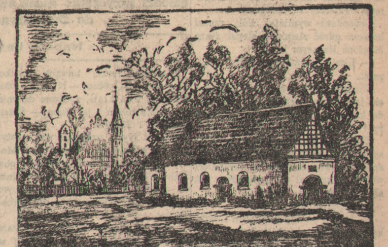
Kościół św. Idziego z XII w. zburzony w 1879 r.