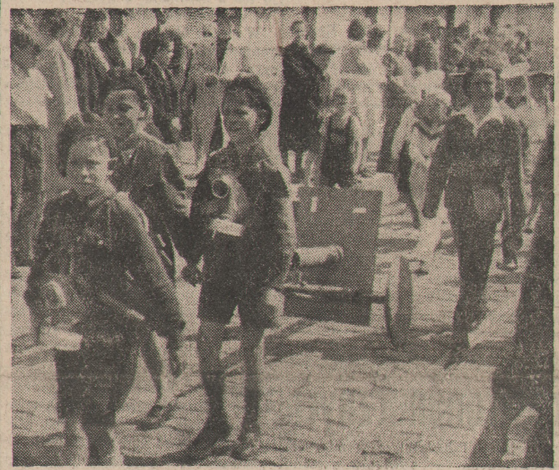
Najmłodsi harcerze na defiladzie