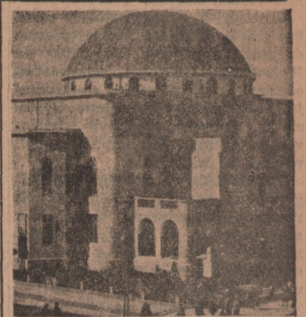
W Palestynie trwają poszukiwania za terrorystami a w szczególności za sprawcami zamachu na Główną Kwaterę angielską w hotelu Dawida. Według doniesień Reutera patrol angielski natrafił podczas rewizji na wielki skład amunicji w podziemiach synagogi w Jerozolimie. Na zdjęciu świątynia, w której piwnicach terrorysty ukryli swój „żelazny skarb”.