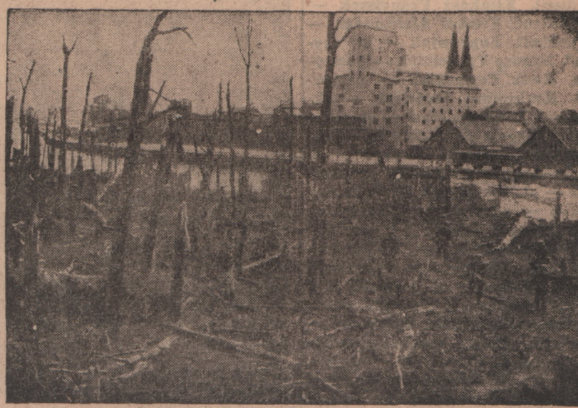
Główna Westerplatte po huraganowym ogniu niemieckiej artylerii.