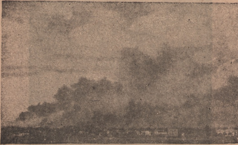
Warszawa w płomieniach.

Dnieprze, nie chciał uczynić, za co zresztą udzielono mu dymisji — było główną przyczyną klęski niemieckiej.