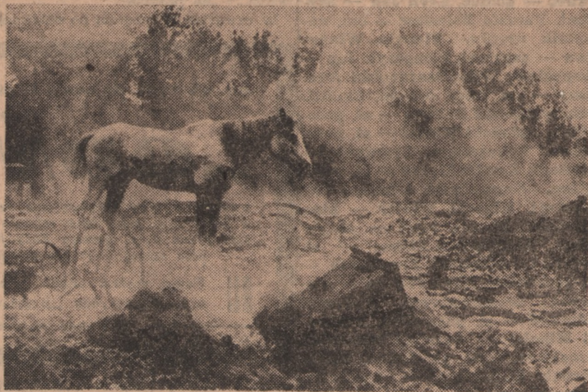
Niemcy świadek barbarzyńskich zniszczeń wojny.

to tylko naturalne skutki niepożądanego położenia geopolitycznego Polski.