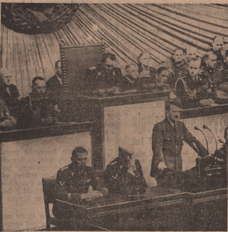
Historyczne posiedzenie Reichstagu, na którym Hitler ogłosił światu, że rozpoczął działania wojenne przeciwko Polsce.