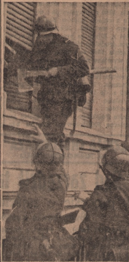
Żołdacy hitlerowscy płądrują mieszkania Polaków.