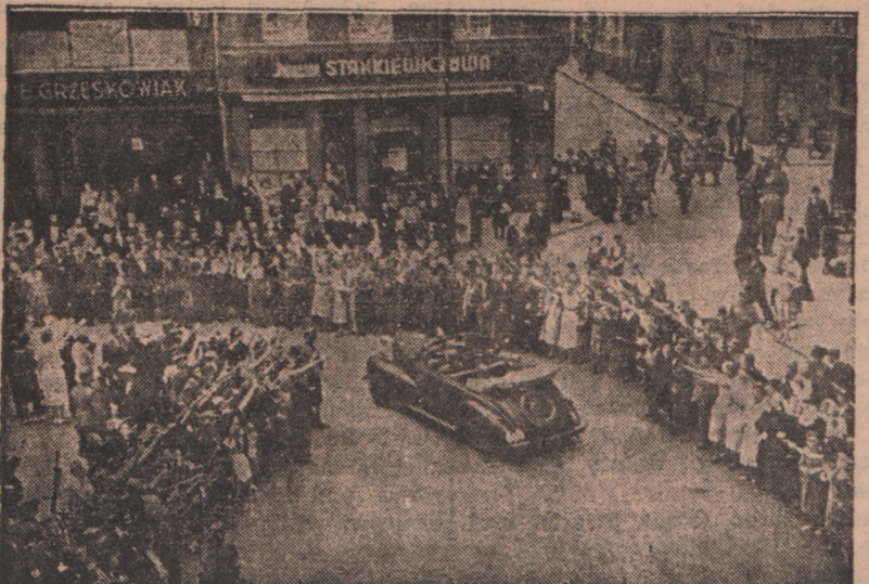
W ślad za hordami hitlerowskimi najędźszo postępowali brunatni „dyktatorzy”. Na migawkę parady hitlerowskiej na St. Regis w Poznaniu.

Mimo wszystko kampanii 1939 roku nie potrzebujemy się wstydić. Obrona „Westerplatte” w podziw wprawiła komendanta niemieckiego krążownika Schleswig Holstein, który to dowódca, przekonany, że po huraganowym ogniu artylerii okrętowej zwykły żołnierz nie utrzyma pozycji, wysłał po taką zdobycz batalion piechoty morskiej, i ta musi się trzykrotnie z