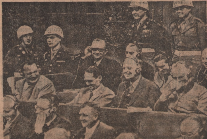
Tak wyglądali na początku procesu

Oświadczenie to wywołało wielkie wrażenie wśród delegatów Konferencji.