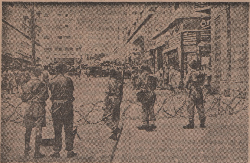
Haifa, jako miasto portowe, do którego głównie kierują się statki wiozące nielegalnych imigrantów żydowskich, jest najbardziej niespokojnym miastem Palestyny. Oto jedna z ulic Haify, na której żołnierze brytyjscy pilnują porządku przy sasiadkach z drutów kolczastych